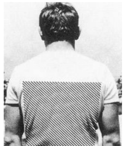
lorsqu'un lutteur est plaqué au sol du bassin jusqu'au milieu des omoplates.

Le lutteur gagnant ou exécutant la prise doit tenir l'adversaire au moins par une prise à la culotte. Le « Bodentätz » constitue la seule exception.