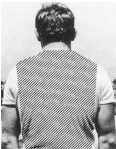
lorsqu'un lutteur est plaqué au sol entièrement.

Une passe est considérée comme terminée si un adversaire est vainqueur ou si la durée de la passe est écoulée. La décision d'une passe intervient